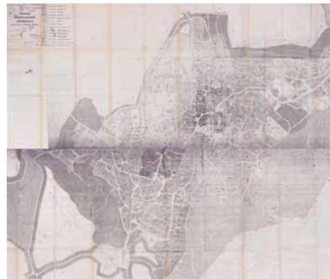
STRUMENTO URBANISTICO VIGENTE – PRG DEL 1976